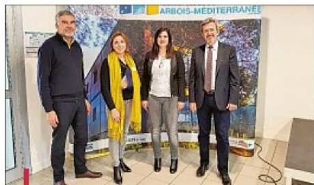
Pas de création ou de croissance réussies sans accompagnement spécifique. Les réseaux sont là pour prendre le relais.

D'abord, on présente et on explique, ensuite on négocie. Le 12/14 de l'Arbois s'est penché hier sur le financement des start-up. Développer son innovation, structurer son équipe, trouver son marché... autant d'étapes qui nécessitent d'importants fonds pour la croissance des jeunes entreprises innovantes. Pour soutenir le développement des jeunes pousses, les acteurs du territoire accompagnent les porteurs de projet pour contribuer à leur réussite.